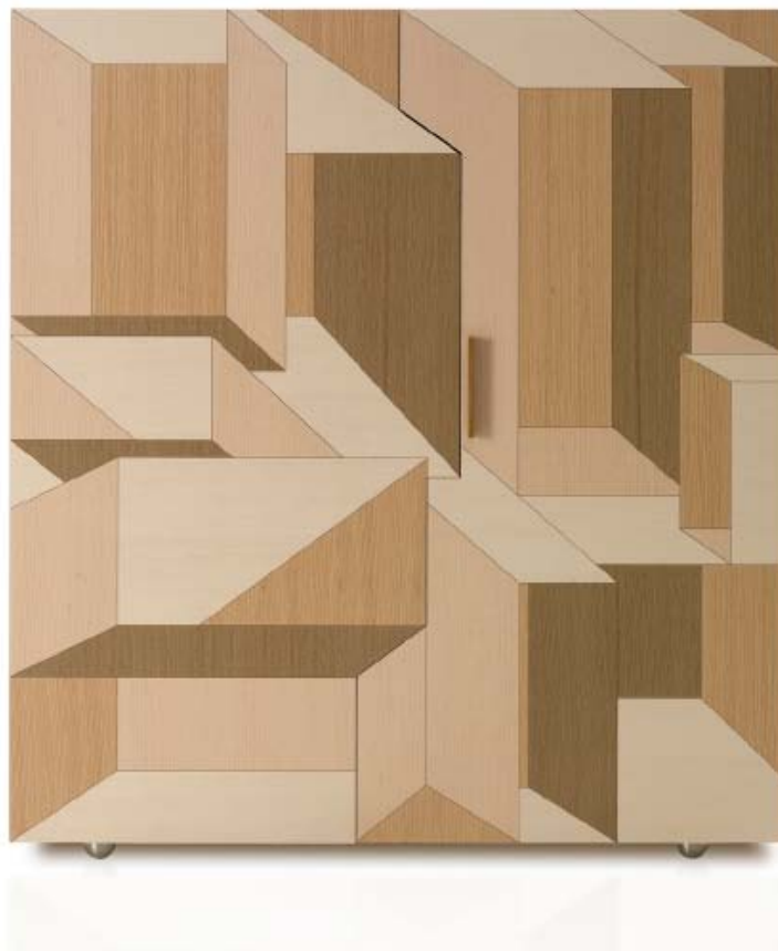
design Front 2011